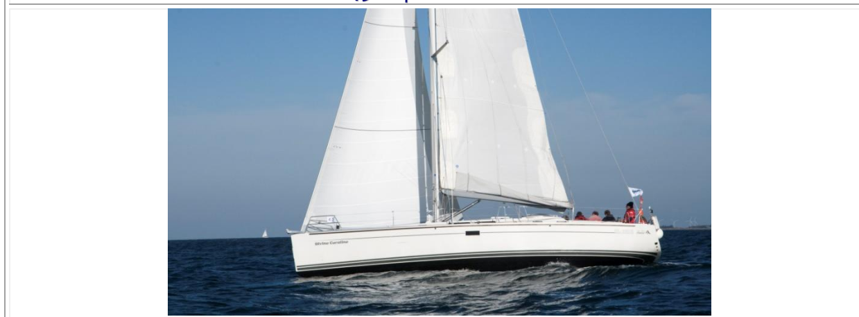
HANSE 430E | SY DIVINE CAROLINE