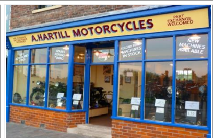
BLACK COUNTRY MUSEUM