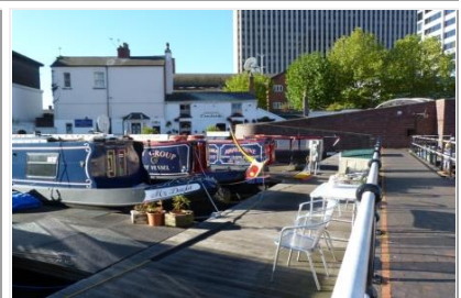
BIRMINGHAM – MARINA 'GAS STREET BASIN'