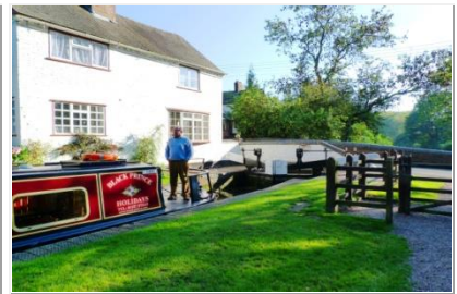
KANALWANDERN & SCHLEUSEN